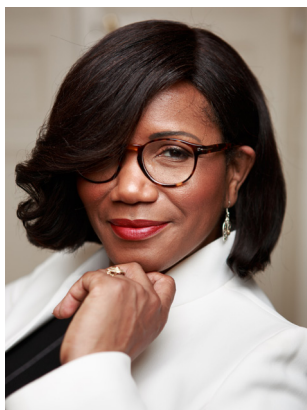
M me Elisabeth MORENO, Ministre déléguée auprès du Premier ministre chargée de l'Égalité entre les femmes et les hommes, de la Diversité et de l'Égalité des chances

L'égalité n'est pas innée, c'est un acquis. Malgré les progrès accomplis, le combat pour l'égalité entre les femmes et les hommes reste toujours d'actualité. Les inégalités auxquelles sont encore confrontées les jeunes filles et les femmes tout au long de leur vie nous révèlent l'ampleur du chemin qu'il nous reste à parcourir.